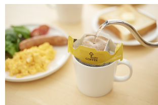
商品パッケージ/イメージ