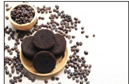
「コーヒーグラウンズ」イメージ