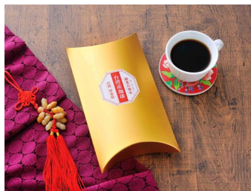
『台湾産珈琲 屏東県』イメージ