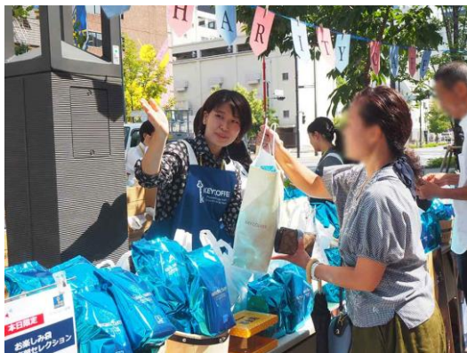
チャリティイベントの様子