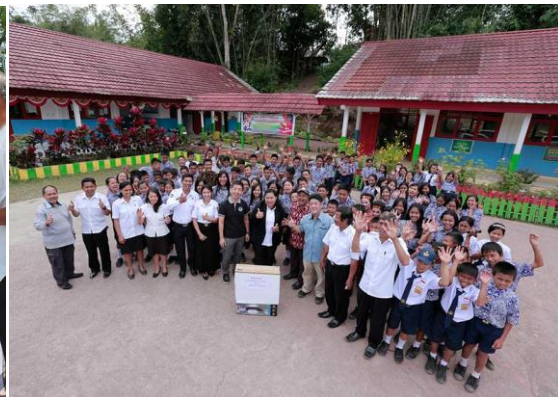
コーヒー生産国への支援イメージ