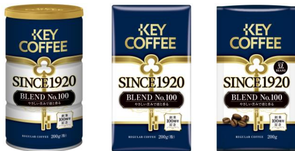
商品画像(左から缶、VP、LP)