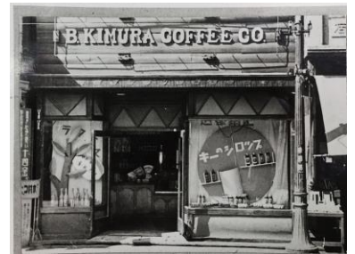
創業当時のキーコーヒー

1920年8月に横浜で創業したキーコーヒーは、2020年に100周年を迎えます。創業時からホテル、喫茶店、カフェといった飲食店の方に納得いただける品質や味わいを提供し続けてきました。「SINCE1920」は、創業時より100年受け継がれてきたブレンド技術と焙煎技術を駆使し、多くのお客様に長年認められてきた味わいをご家庭に、という思いから生まれた新シリーズです。