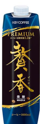
まろやか仕立て 贅香 微糖