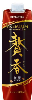
まろやか仕立て 贅香 無糖

キーコーヒー株式会社(本社:東京都港区、社長:柴田 裕)は、チルドコーヒーカテゴリ専用の『まろやか仕立て 贅香』シリーズを、より贅沢な香りにリニューアルして、2019年3月1日(金)より発売いたします。